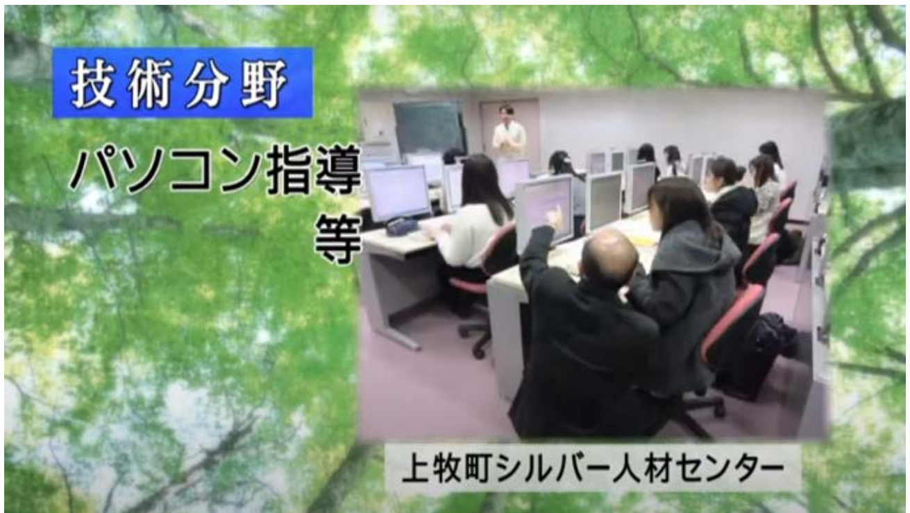
奈良市シルバー人材センターHP より転載