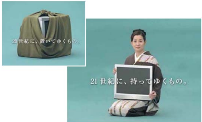
イメージキャラクターの吉永小百合さんがブラウン管テレビを風呂敷に包み、液晶テレビを「21世紀に、持ってゆくもの。」と語るインパクトのあるテレビコマーシャルを放映

中でもこの変遷は、20世紀から21世紀へ変わる時でもあり吉永小百合さんの当時のコマーシャルは新しいテレビが生まれていることを強く印象付けるものであった。