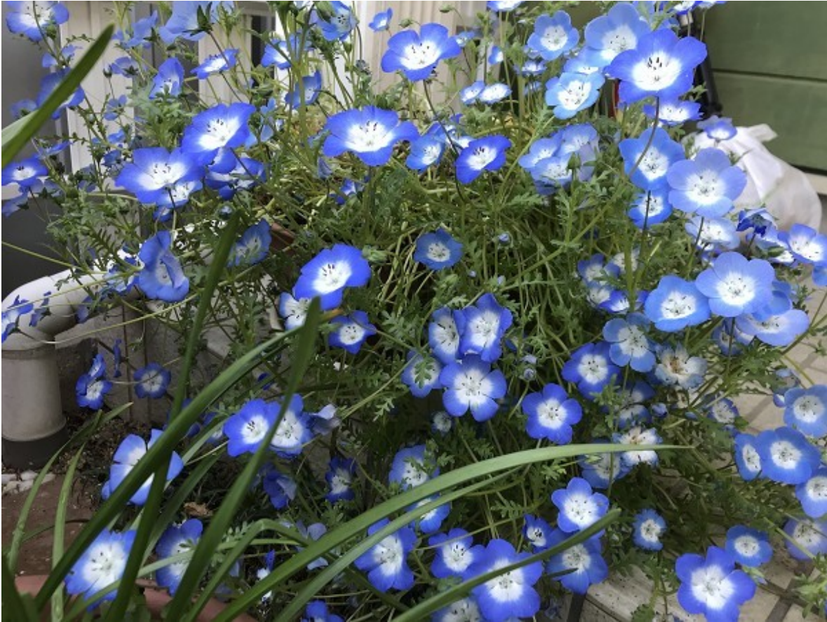
生駒技研に咲いたネモフィラ